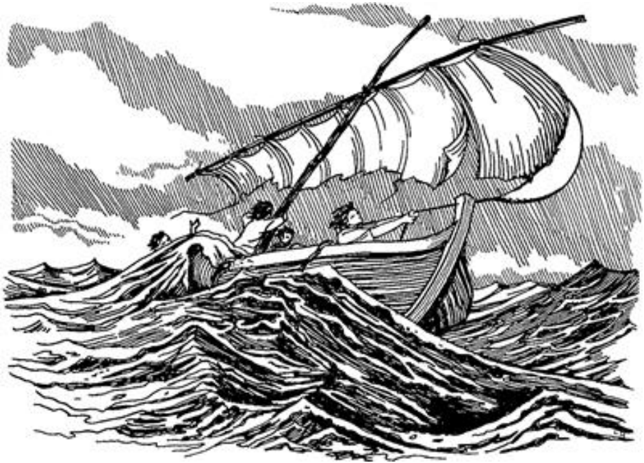
Tɔnmɔ kɔrɔ ki jɔgɔwɔ (Kapye 27.41)

lere cɛnme shyen naa nafa taanri ma yiri kɛ ma yiri kɔgɔlɔni (276). 38 Naa pàa kaa ka ma tin, a pè si shɔgɔlɔ ke wɔ ma ke wa wa tɔnmɔ, jɔngo tɔnmɔkɔrɔ ki ta ki tifaga.