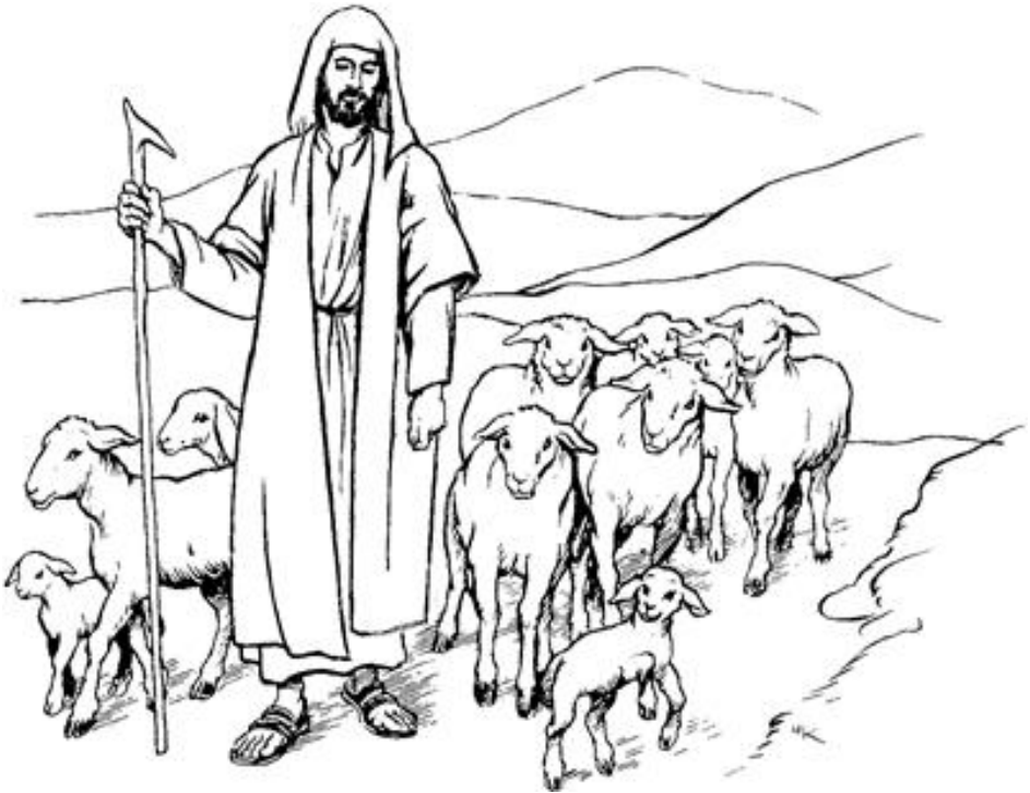
Simbaala kɔnrifɔ naa wi simbaala (Yuuro 23)

Yenɛle li yen na go sigefɔ paa yaayoro kɔnrifɔ yen